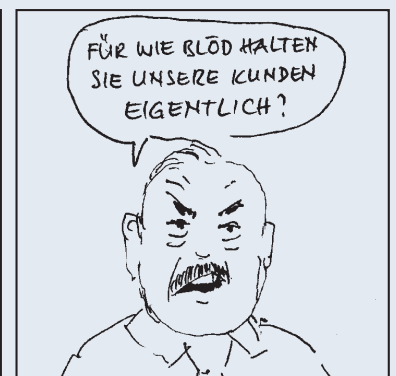
3. Analyse der überarbeiteten Version.