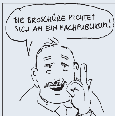
1. Das Briefing.