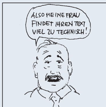
2. Kritik des Resultats.